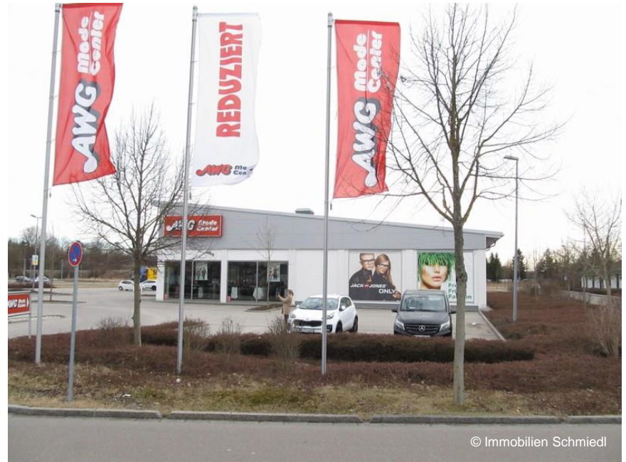
Fahnenmasten für Zusatzwerbung