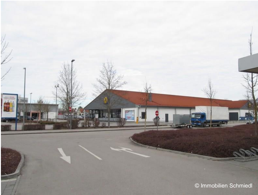
Große Zu- und Abfahrt für LKW